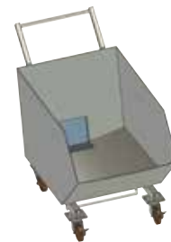
反転リフト対応モデル