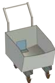
フォークリフト対応モデル